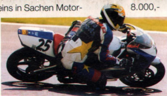
Marken-Artikel: Deutschlands Nachwuchs-Rennfahrerschule Nummer eins, der ADAC-Junior-Cup, hat exklusiv auf Aprilia umgesattelt.

Aprilia RS 125 gefahren. Erlaubt sind Modelle ab Baujahr '96 (Umbaukit notwendig), Aprilia bietet aber auch die 99er RS 125 mit Kit zum Festpreis von DM 8.000,- (brutto) an. Die Einschreibgebühren betragen 1.500,- DM (inkl. 4-Tage-Training in Leddenon/F). Bereits im letzten Jahr waren nurmehr Fahrer auf Aprilias unterwegs, da die RS 125 schlicht-